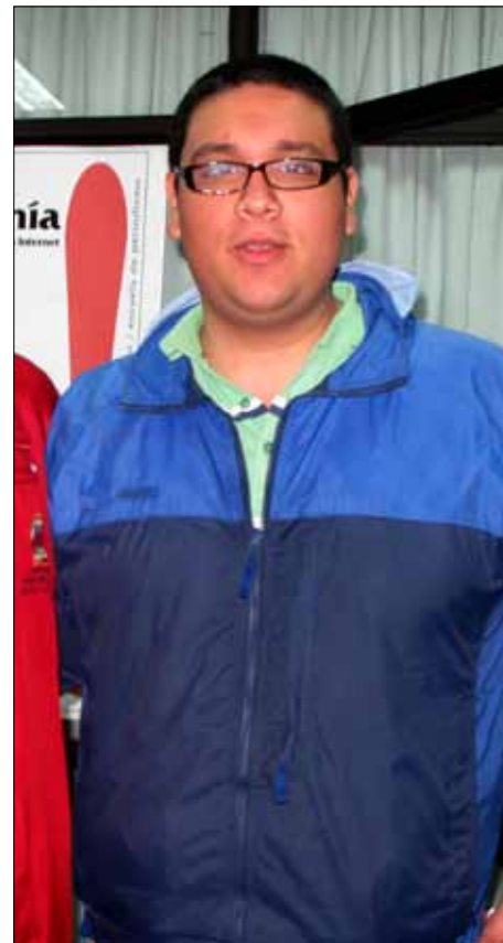
"Si no es en el fútbol, no se en qué otra cosa podría trabajar", dice el joven.

Mientras termina de confesar ese detalle, se acomoda en la silla para, quizás, recordar algún otro recóndito pasaje de aquella etapa