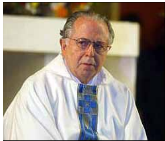
Padre Fernando Karadima, ex párroco de la parroquia El Bosque.

Afectada por una severa pérdida de confianza, la Iglesia Católica encara el desafío de enfrentar los casos de abusos sexuales cometidos por religiosos a nivel